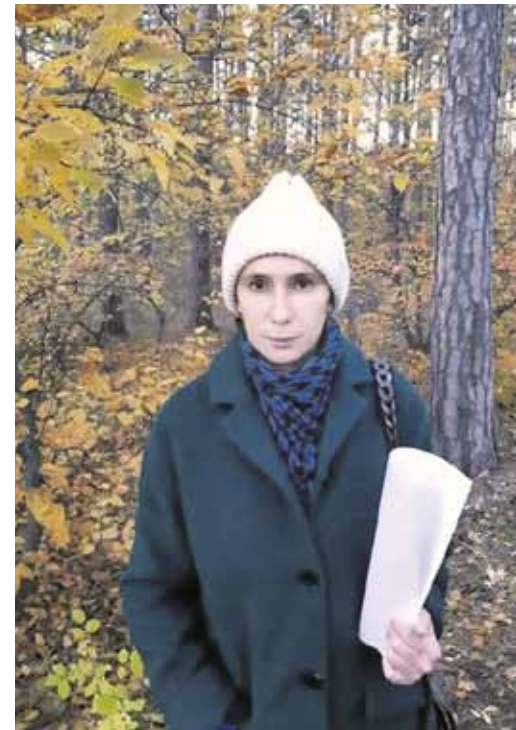
В Челябинском бору с депутатским запросом.

• Региональная целевая программа подготовки медицинских кадров врачей и сестёр. Непосредственно для нужд каждого лечебно-профилактического учреждения, с учётом фактического дефицита кадров. С необходимостью отработки не менее 5 лет по специальности, при условии бесплатного базового обучения и получения диплома со средним баллом не менее 4,0, а также обучения в интернатуре (ординатуре) и специализации. Предусмотреть финансовые инструменты воздействия на работника при разрыве контракта.