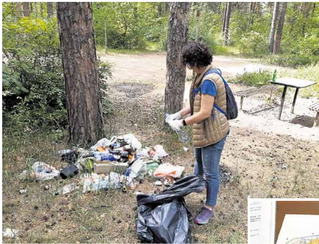
На субботнике в Челябинском бору.

Для этого должна быть принята качественная программа развития здравоохранения.