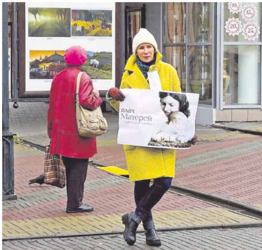
Одиночный пикет на ул. Кирова, 2019 год.

Благодаря фонду «Горожане» мы смогли вести переговоры с представителями